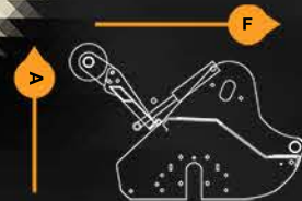
Apertura dell portón hidráulico de 550 mm.